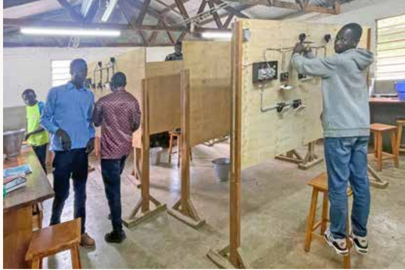
Jährlich schließen ca. 150 junge Menschen ihre zwei- bzw. dreijährige Ausbildung in sieben Handwerksberufen ab.