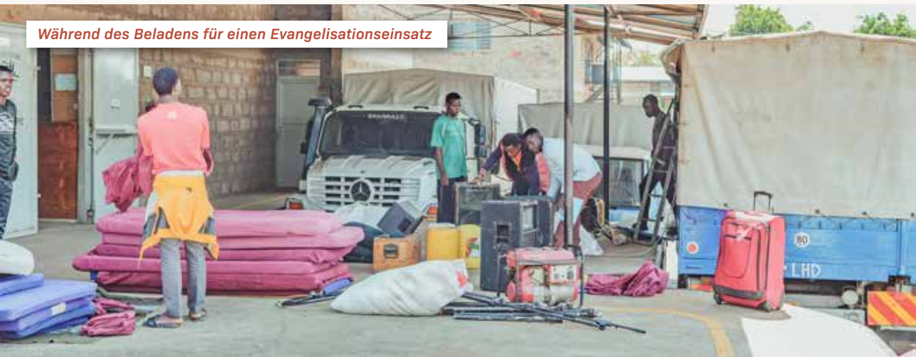
Während des Beladens für einen Evangelisationseinsatz

Wir sind Gott wirklich dankbar, denn er hat treu für die Finanzen und wunderbare Teams aus unseren drei ►