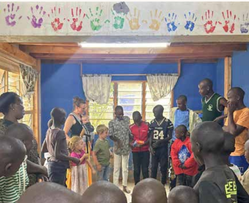
Auch im Kinderheim stehen große Veränderungen an