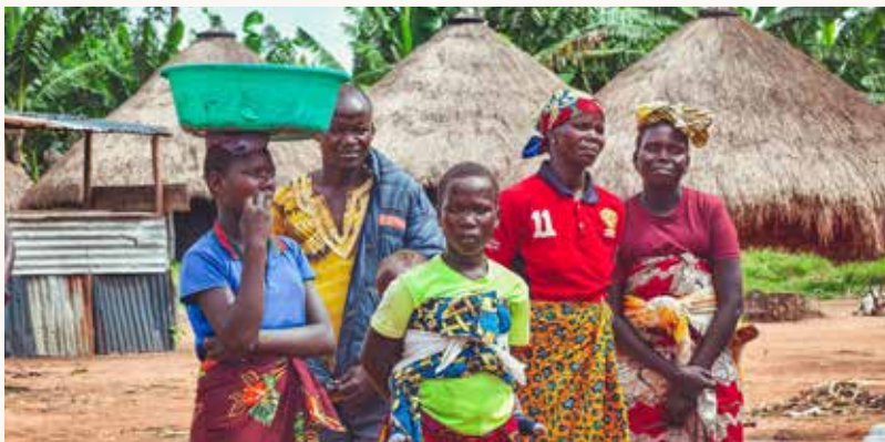
Menschen in Afrika mit dem Evangelium erreichen - trotz aller Veränderung bleibt dies das Hauptanliegen von DIGUNA.

Deutlich wird, wie Gott sein Werk über Kontinente hinweg voranbringt: durch Evangelisationseinsätze in abgelegenen Regionen Ugandas und Kenias, Leiterschulungen und Gefängnisdienste, neue Schritte im Tschad sowie innovative Radioarbeit unter unerreichten Volksgruppen. Es geht um Aufbrüche in unbekannte Gebiete, interkul-