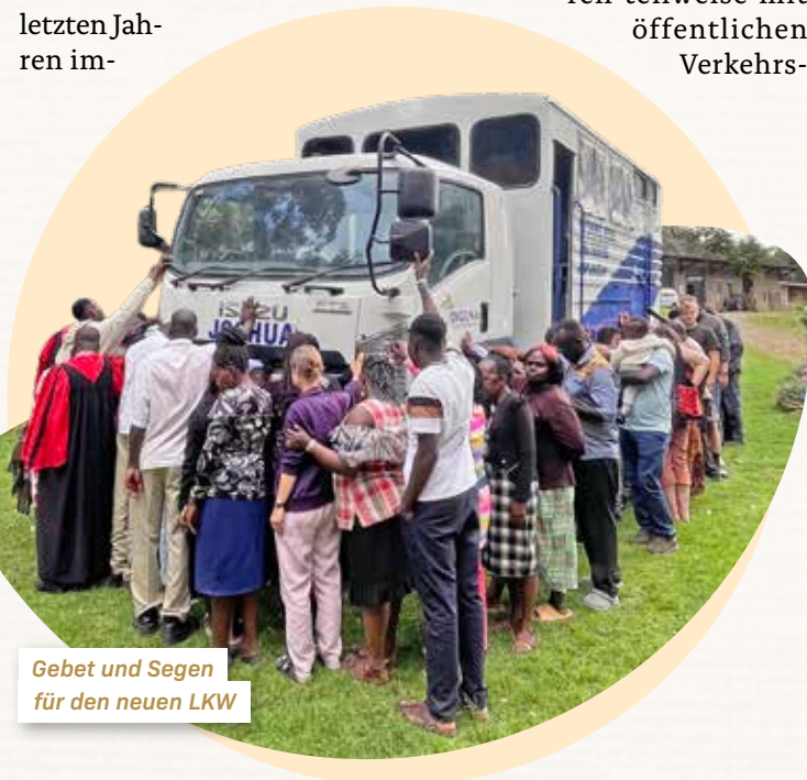
Gebet und Segen für den neuen LKW

Unsere Junior-School wird gerade mit einem neuen Gebäude erweitert. Leider zieht es viele gute Lehrkräfte in öffentliche Schulen und wir