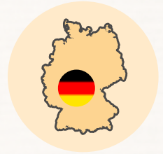
Größenverhältnis Deutschland / Afrika